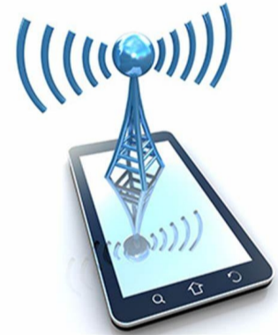
Réseau wifi, téléphonie, radio