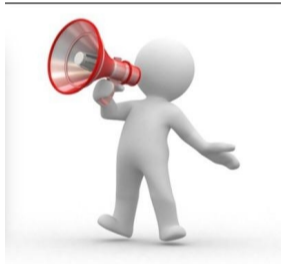
Dispositif à la voix